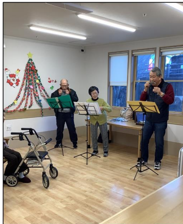
大府市社会福祉協議会ハーモニカボランティア（12月16日）