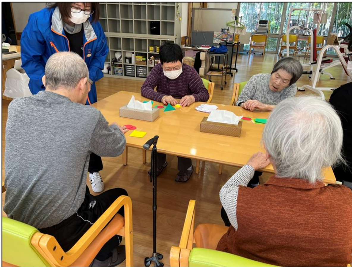
認知症カフェ参加(11月9日 あんずカフェ)