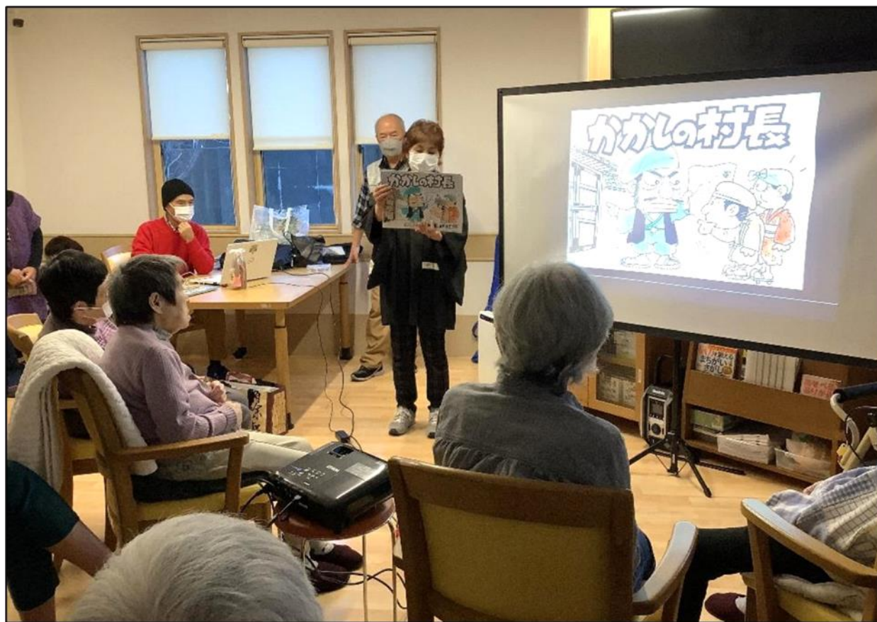
「お山の杉の子」さん(12月4日 電子紙芝居ボランティア)