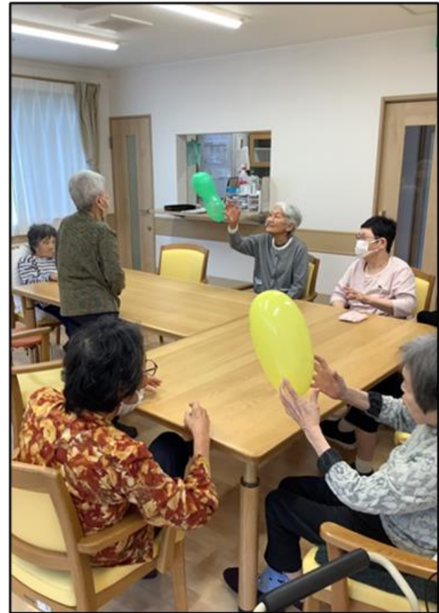
集団レクリエーション