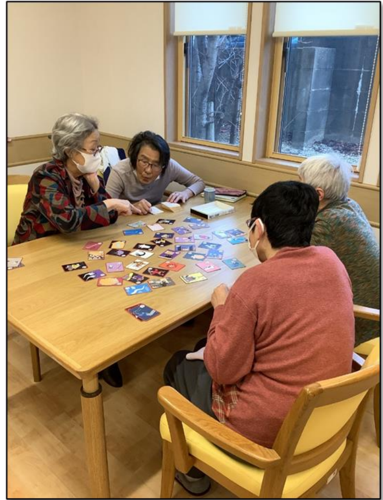
集団レクリエーション